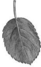
Жилкование листа -