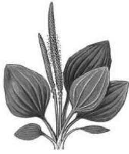
Жилкование листа -