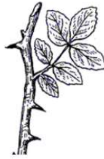
Видоизменение листьев -