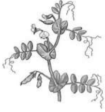
Видоизменение листьев –